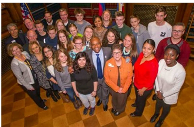
Foto: Bürgermeister Michael Hancock mit der Berliner Gruppe und seiner Youth-Commission

Zu den Programmpunkten in Denver gehörte, neben dem Besuch des Capitols, in dem sich die beiden Parlamentskammern Repräsentantenhaus und Senat befinden, des Denver International Airports und eines CBS-Fernsehstudios, auch die Teilnahme an einer Sitzung der Youth Commission, die dafür zuständig ist, dem Bürgermeister Vorschläge zur Verbesserung der Situation von Jugendliche zu machen. Ein wenig vergleichbar mit unserem Kinder- und Jugendparlament.